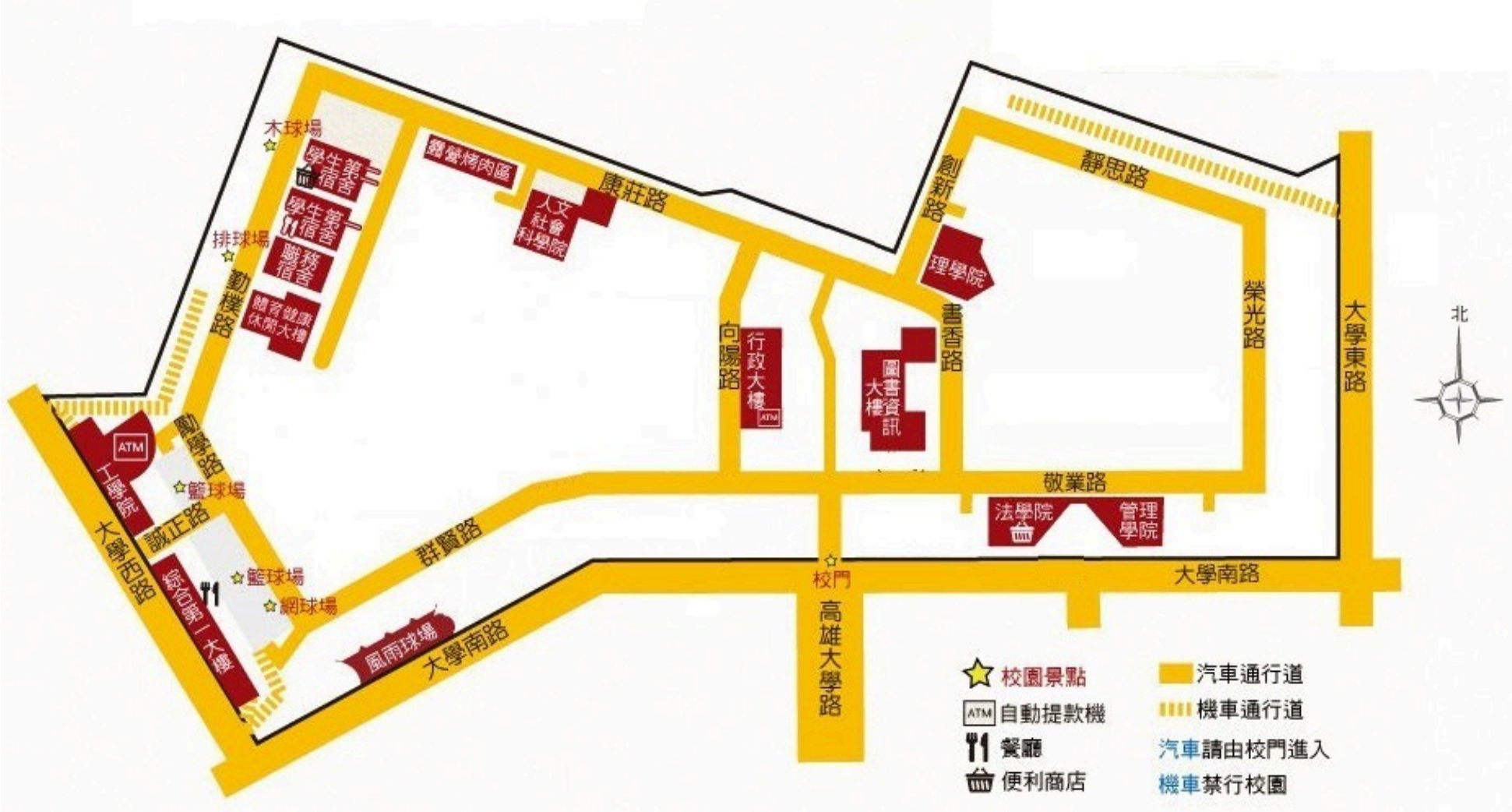
國立高雄大學校內大樓位置圖